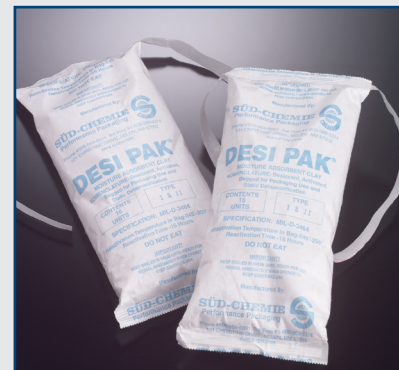
Трака од ушивених десикант врећице

Sūd-Chemie чепови индикатори влаге детектују било какву промену релативне влажности у затвореној амбалажи. Чепови су постављени у зид контејнера и омогућавају да се читавања могу вршити ван контејнера. Чепови индикатори влаге су прилагодљиви за готово све апликације за Method II паковања према Mil-P-116 и AS26860 спецификација у ваздухопловству. Доступни су у различитим величинама и конфигурацијама.